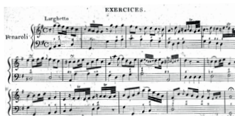
Eine figurierte Version eines Partimento von Fenaroli (Bild: aus Alexandre Étienne Choron [mit Vincenzo Focchi]: Principes d'accompagnement de l'école d'Italie [...], Paris 1804, S. 104)