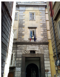
Das Eingangportal zum heutigen Konservatorium in Neapel.