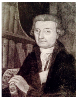
Das einzige Bildnis von Giuseppe Sigismondo. (Bild: aus Ettore Santagata: Il museo storico musicale di «San Pietro a Majella» , Neapel 1930, S. 42)