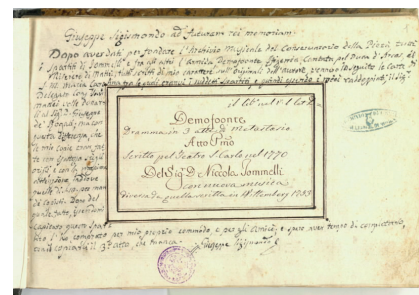
Titelblatt von Jommellis Demofonte mit Notizen von Sigismondo.